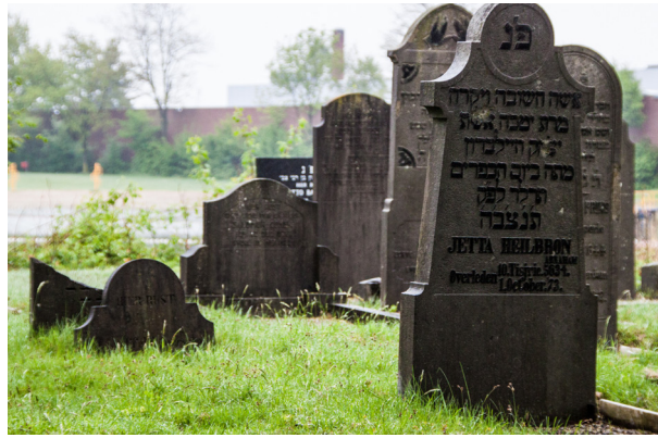
Joodse Begraafplaats, Meniststraat

In Dinxperlo leefden vóór 1940 ongeveer 80 Joodse mensen. Slechts zesentwintig daarvan hebben de oorlog overleefd. De namen van de Joden die het niet hebben overleefd, staan vermeld op het oorlogsmonument aan de Kwikkelstraat in Dinxperlo. Tegenover dit monument stond vroeger de Dinxperlose Synagoge. Deze werd bij bombardementen in 1945 verwoest en niet meer herbouwd omdat er te weinig Joden in Dinxperlo woonden.